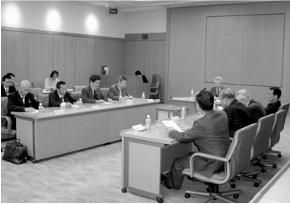
▲ 2月17日に県営サンアリーナで開催した第17回協議会

〒516-0021 伊勢市朝熊町字鴨谷4383-4 三重県営サンアリーナ内 TEL 0596-21-1020 FAX 0596-21-1022